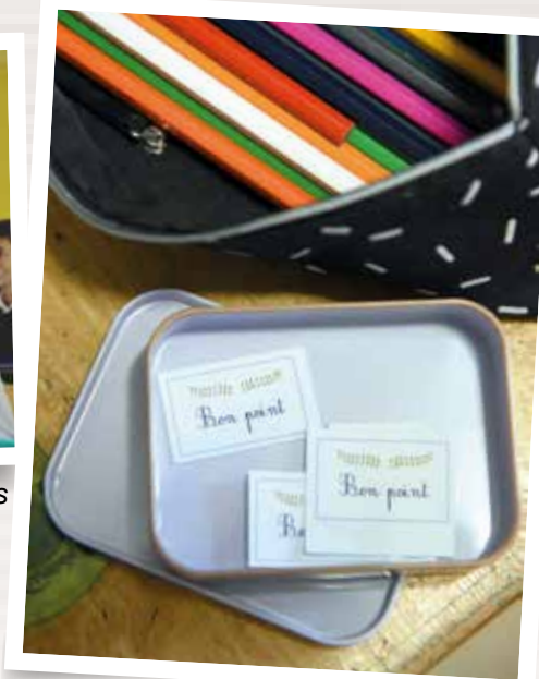
Des élèves encouragés à l'école Notre-Dame de l'Espérance (Bourges, 18)