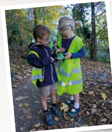
Sortie automnale pour les élèves de l'école du Saint-Enfant Jésus (Fontainebleau, 77)