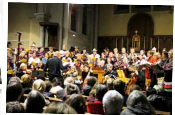
Les élèves du collège de la Sainte-Famille participent à un concert avec l'Ensemble Vocal de Grenoble (Saint-Ismier, 38)