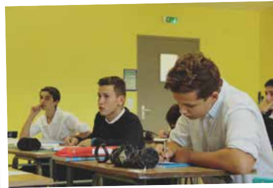
Session d'examens à l'Institut Croix-des-Vents (Sées, 61)