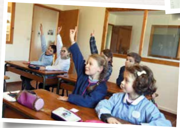
Des élèves heureux d'étudier à l'école Notre-Dame de l'Espérance (Bourges, 18)