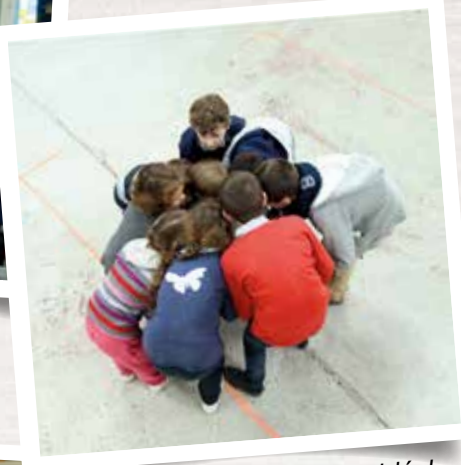
La récréation, moment idéal pour se faire des confidences