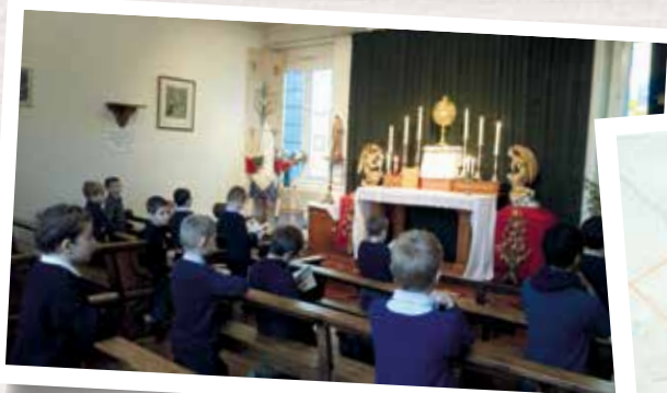
Adoration du Saint-Sacrement au cours Charlier (Nantes, 44)