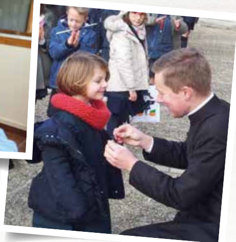
Remise de la médaille d'honneur à l'école Sainte-Jeanne d'Arc (Lyon, 69)